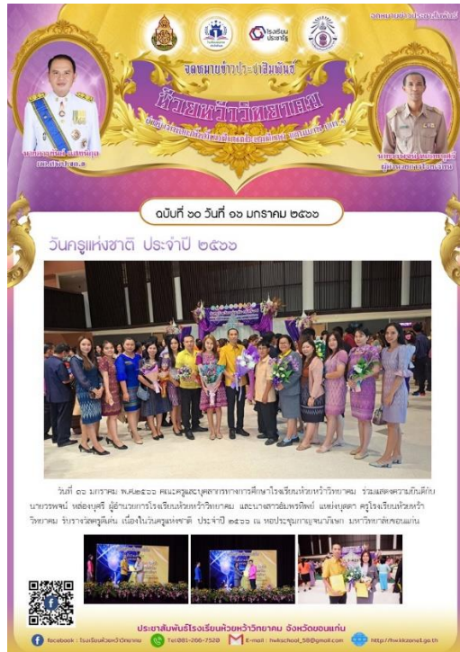
กิจกรรมวันครูแห่งชาติ ประจำปี ๒๕๖๖