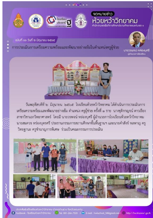
การประชุมเตรียมความพร้อมและพัฒนาอย่างเข้มในตำแหน่งครูผู้ช่วย