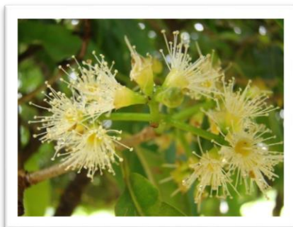
“ดอกหว้า หมายถึง ความอุดมสมบูรณ์”